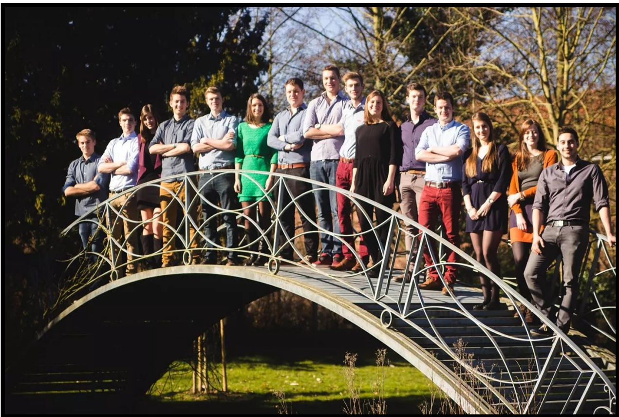
Kandidaat-praesidium 86 e werkingsjaar